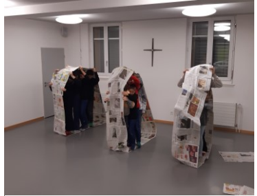
Die Minis beim Zeitungsräupchen-Wettrennen

Am Freitagabend vor den Sportferien trafen sich 13 Ministranten und Ministrantinnen zum Spielabend. Als erste Aufgabe wurden Zeitungen zusammengeklebt und anschliessend in 4-er Gruppen ein Zeitungsmarsch absolviert. Es gewann die Gruppe, welche sich sehr sorgfältig und eher bedächtig der Herausforderung annahm.