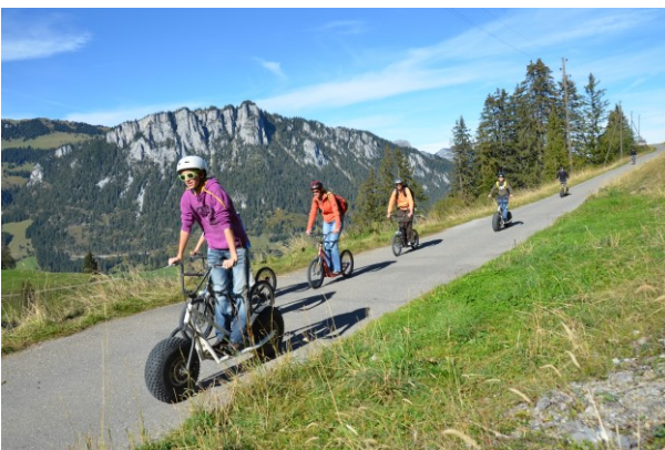
Mit Geschwindigkeit ins Tal